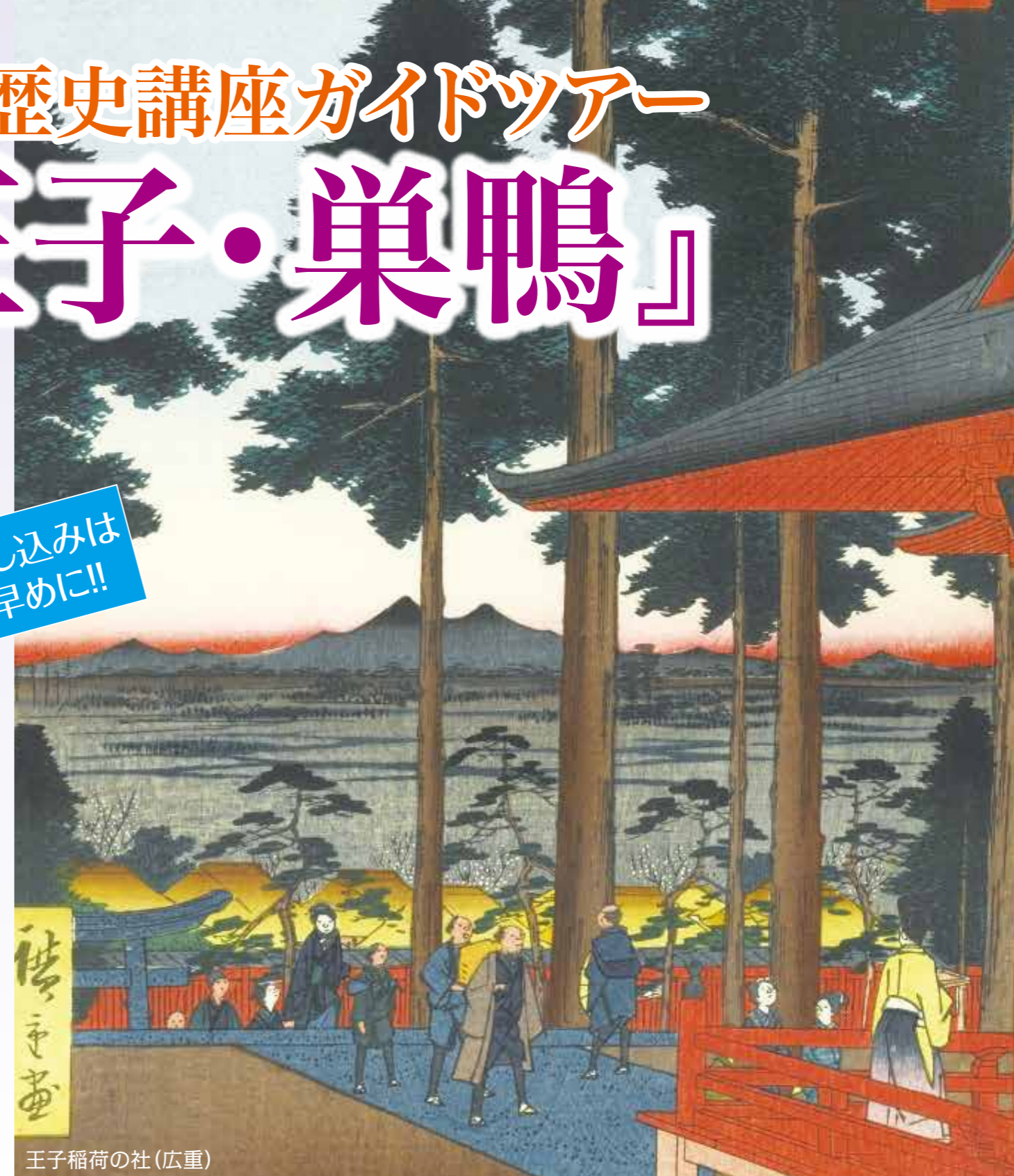
王子稲荷の社(広重)