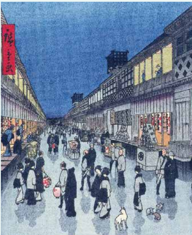
猿わか町よるの景