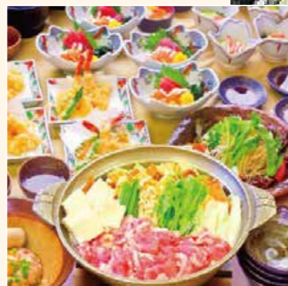
江戸沢 東京総本店 ランチ(イメージ)